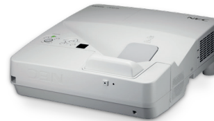
*Beamer im Lieferumfang nicht enthalten